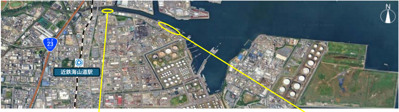
令和7年度四日市海岸塩浜地区Ⅳ工区 護岸(改良)本体工事(その2)

令和8年度における四日市港海岸直轄海岸保全施設整備事業で実施する工事および調査の概要をお知らせいたします。