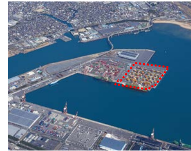
ターミナル完成予想写真

四日市港霞ヶ浦北ふ頭地区において、コンテナ貨物量の増加・船舶の大型化に対応するため、国際物流ターミナルを整備しています。また、南海トラフ地震等の大規模地震災害に備え、安定的な物流機能を確保するため、耐震強化岸壁としての役割も担っています。岸壁整備に必要な地盤改良に使用する砂は、河川事業と連携し、河道掘削から発生する砂を活用することで資源の効率的な利用にも取り組んでいます。