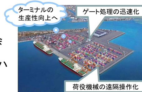
AIコンテナターミナルの検討

また、霞ヶ浦北ふ頭地区で整備中のコンテナターミナル(W81)において、荷役機械のハイブリッド化や遠隔操作、IoTを活用したゲート処理の迅速化等を取り入れたAIコンテナターミナルの実現に向けて、地元港湾利用者と連携して取り組みを進めています。