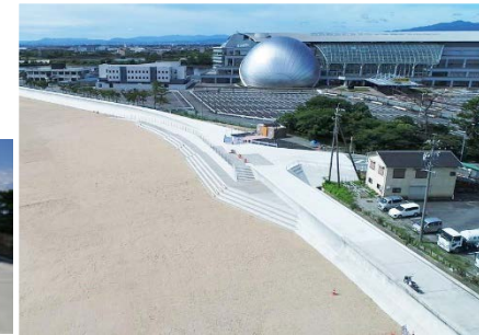
阿漕浦・御殿場工区整備後