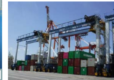
荷役機械のハイブリッド化